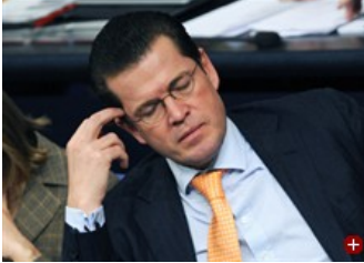
Heftig in der Kritik: Verteidigungsminister zu Guttenberg (CSU)

Verteidigungsminister zu Guttenberg hat nach den Vorfällen auf der „Gorch Fock“ den Kommandanten des Schiffs absetzen lassen und die Rückkehr des Dreimasters nach Deutschland angeordnet. Der Wehrbeauftragte lobt die Entscheidung - doch die Opposition fordert persönliche Konsequenzen vom Minister.